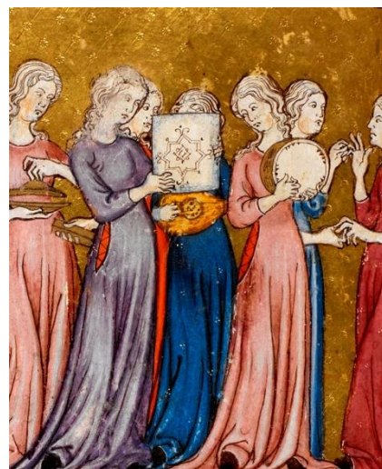
“The dance of Miriam” (The Golden Haggadah)

El Repertori escollit per a aquest concert és una trobada entre cultura i art, entre peculiaritats locals i universals, entre l’individu i la comunitat. La trobada entre la cançó tradicional i la d’autor representa el procés d’humanització que inseparablement vincula les arrels culturals d’una comunitat i la recerca de l’acompliment personal cap al misteri.